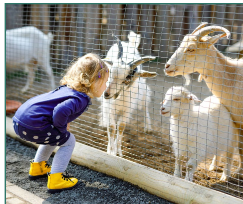
Un niña interactuando con cabras que están detrás de una valla.