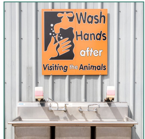
Una estación para el lavado de manos con la señalización apropiada para los visitantes.