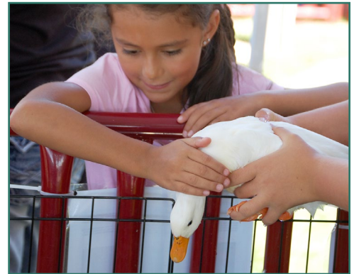
Un niña acariciando un pato.