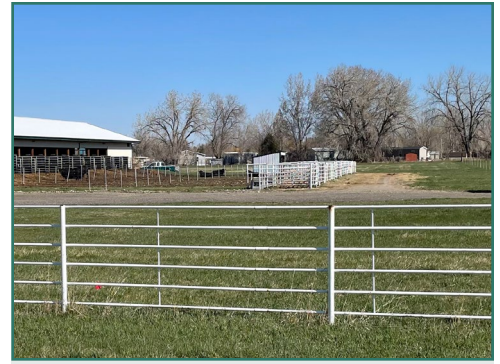
El ganado está dentro de un corral y hay otro cerco para evitar el contacto con otros animales.