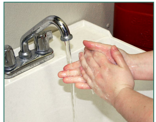
Una persona que se lava las manos antes o después de tener en contacto con animales.