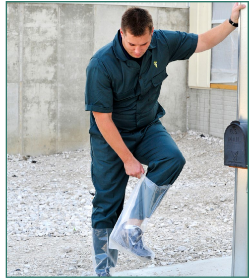
Una persona se pone cubrebotas antes de entrar en las instalaciones.