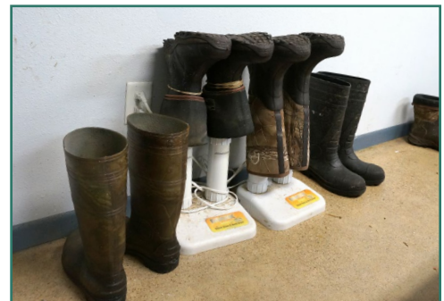
Lugar para secar las botas limpias y para ponerse botas limpias.